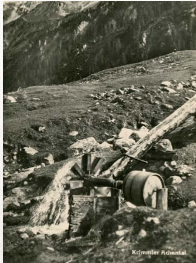
Wasserrad treibt den Butterkübel Postkartenmotiv

Bevor es auf den Almen Stroh als Streu gab, wurde „Wald- und Mähstreibe“ gerichtet. Moos und „Plissn“ (= Baumnadeln) aus dem Wald, das Gras aus sumpfigen Wiesen wurde gemäht und getrocknet und als Streu verwendet.