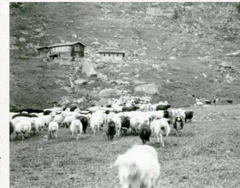
Innerkees 1940er Jahre

1906 kaufte sie für die Erweiterung der Hütte noch einmal 300 Quadratklafter.