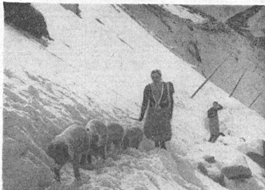
Auch Schweine müssen durch den Frühjahrsfirn wandern. Ruß schützt sie vor Gletscherbrand

liegen in dieser Höhe noch gewaltige Schneemengen. Wollte man warten, bis diese geschmolzen sind, so würde der halbe Sommer vergehen, ehe die Tiere auf die Alm kämen. Daher wird Ende Mai oder Anfang Juni bei sicheren Wetterverhältnissen das ganze für die Almfahrt bestimmte Vieh im letzten Ort des Ahrntales in Kasern, zusammengetrieben und die „Pusterer“, wie sie kurz genannt werden, wagen den Übergang über den Krimmler Tauern.