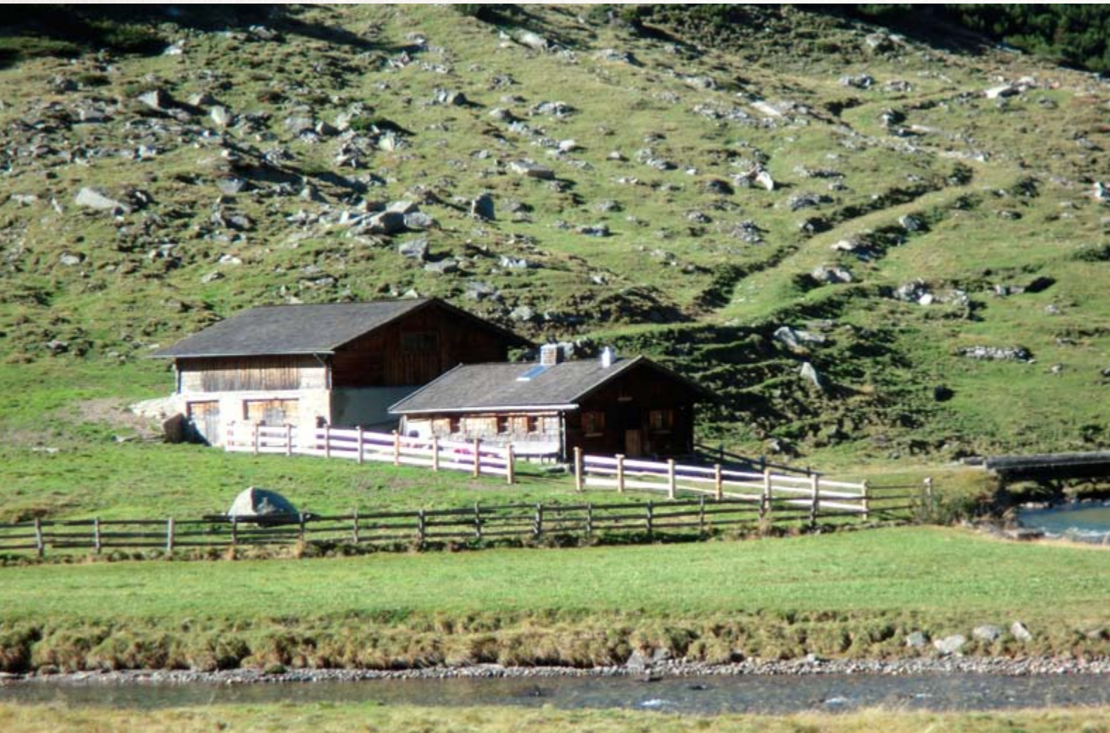
Das Albl

Auf der Alm wurden bis in die 1970er Jahre bis zu 14 Rinder, bis zu 20 Ziegen und 1-2 Schweine gehalten.